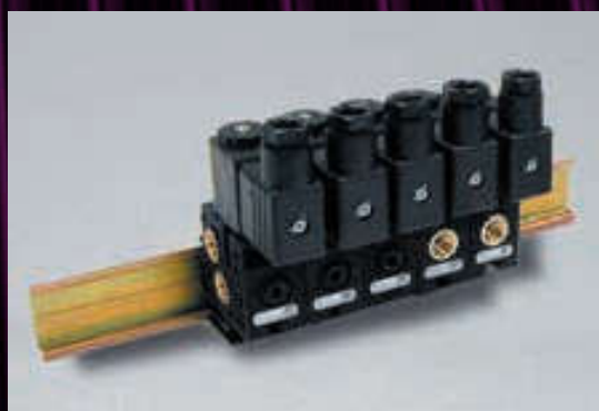
Electropilotos 1/8" - Ø 4 mm